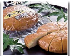
チーズ入り燻製蒲鉾