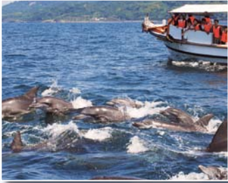
イルカウォッチング